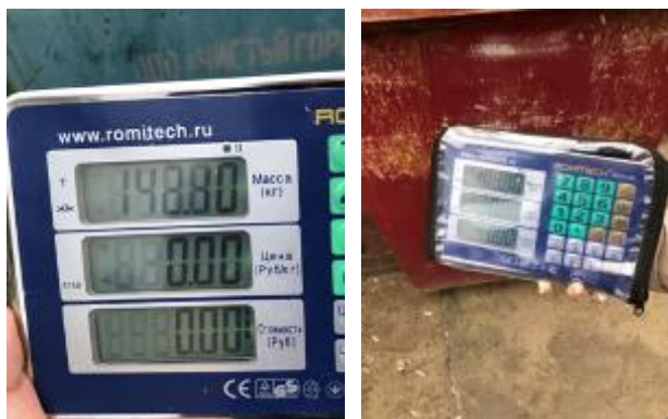
Рис. 2. Примеры фотографий взвешивания контейнера на платформенных весах

G_{klij} (кг) и массой пустого контейнера G_{k0ij} (кг), т.е.