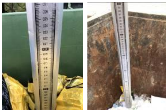
Рис. 1. Примеры фотографий измерения объема накопления отходов в контейнере

При измерении объемов накопления в контейнере требуется разровнять поверхность мусора, не уплотняя его. После этого на поверхность мусора устанавливается вертикально линейка (рейка, рулетка), с помощью которой определяется расстояние l_{vij} (м) от поверхности мусора до края контейнера. Измерение заносится в информационную систему в виде числового значения, а также в систему загружается фотография, на которой четко видно измеренное расстояние (рис. 1).