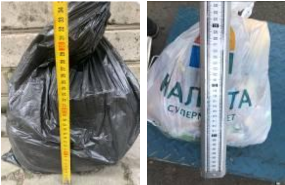
Рис. 3. Примеры фотографий измерения объема при бесконтейнерном накоплении отходов

рение объемов накопления проводится в специальном пакете (рис. 3 и рис. 4).