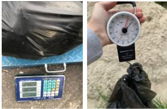
Рис. 4. Примеры фотографий взвешивания при бесконтейнерном накоплении отходов

Информационная система должна отличать объекты с бесконтейнерным накоплением отходов, так как для них объем отходов определяется не одним значением l_{vij} , а совокупностью значений диаметра d_{vij} (м) и высоты ( h_{vij} ) пакета с отходами.